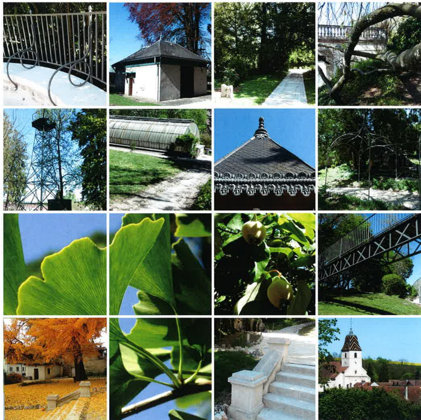
Arbre aux 40 écus (Ginkgo biloba) élu arbre de l'année 2016 par le magazine Terre Sauvage

Le parc Lamugnière est ouvert tous les jours du 1 er octobre au 31 mars de 8h à 18h du 1 er avril au 30 septembre de 8h à 20h