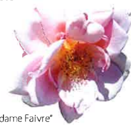
Rosier "Madame Faivre"